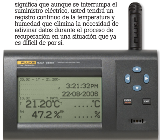
El termohigrómetro "DewK" modelo 1620A

Estos instrumentos tienen algunas de las características que los instrumentos a los que sustituyen, como exactitud, rastreabilidad, suministro eléctrico y la capacidad de montarse en un lugar de cómodo acceso. Sin embargo, los instrumentos más modernos pueden conectarse a redes, de forma que permiten almacenar la información en bases de datos a las que se otorga acceso a los usuarios que tengan derechos de seguridad. Pueden configurarse alarmas para advertir a jefes y técnicos de la existencia problemas en tiempo real, e incluso un programa informático puede enviar mensajes de correo electrónico a buscapersonas y teléfonos móviles. Además, la alimentación de reserva mediante batería significa que aunque se interrumpa el suministro eléctrico, usted tendrá un registro continuo de la temperatura y humedad que elimina la necesidad de adivinar datos durante el proceso de recuperación en una situación que ya es difícil de por sí.