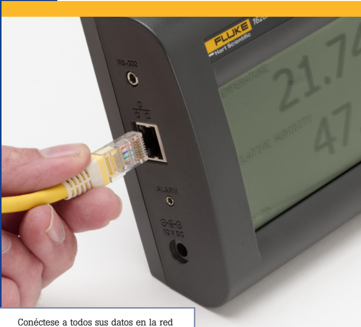
Conéctese a todos sus datos en la red