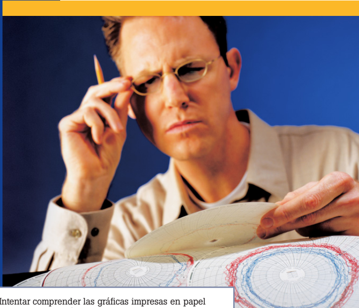
Intentar comprender las gráficas impresas en papel puede resultar difícil.