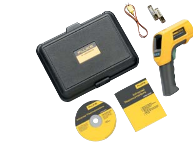
Fluke 566 y accesorios incluidos