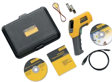
Fluke 568 y accesorios incluidos