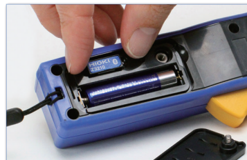
Paso 1: Instala el Z3210 en el instrumento localización varía según modelo.