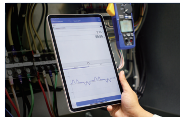
Paso 2: Inicia la aplicación instalada